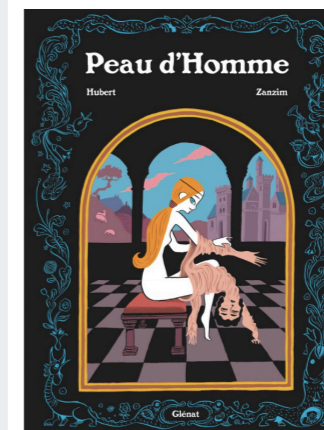
« Peau d’homme » d’ Hubert et Zanzim

‘ Quelles sont vos sources d’inspiration ? ’