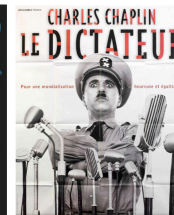
« Le dictateur » de Charlie Chaplin