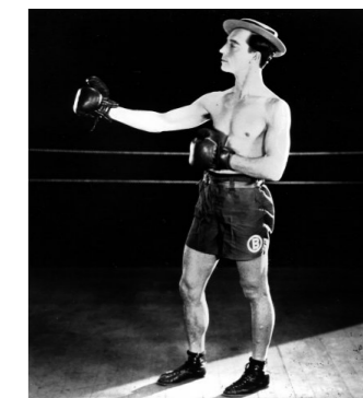
« Le dernier round » de Buster Keaton